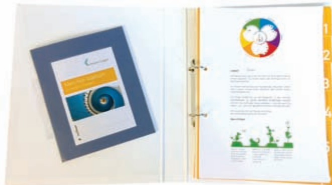
Eine Mappe, die vieles einfacher macht.

Um unseren Patienten eine langlebige und gut strukturierte Sammlung ihrer Unterlagen zu ermöglichen, schwebte uns ein stabiler Ordner mit einem übersichtlichen Register vor. Dank finanzieller Unterstützung durch die Stuttgarter Olgäle-Stiftung und die CI-Hersteller konnte das Projekt dann im Sommer 2017 starten.